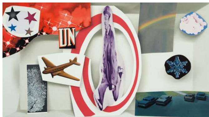
Elliott, David. Chutes . 2007.

Pour ce premier atelier, le MAC s'inspire de l'œuvre Chutes , de l'artiste québécois David Elliott.