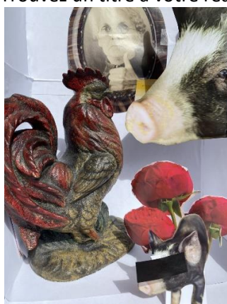
L'arbitre ou le combat des animaux