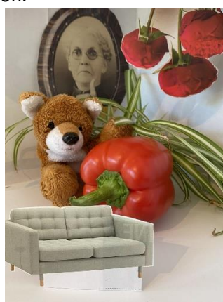
En bonne compagnie